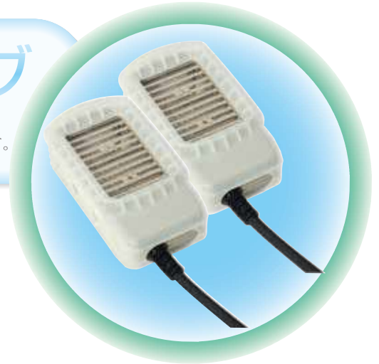
光線治療器の照射光イメージ

様々なポイントの使用に対応することで、より多くのニーズにこたえます。 ※具体的な各部位への照射例はウラ面をご参照ください。